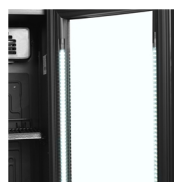
Éclairage LED dans le cadre de la porte